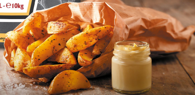
FRITESSAUS 25% 10 liter - 091853