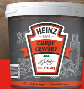
CURRY GEWÜRZ 10 liter - 091851