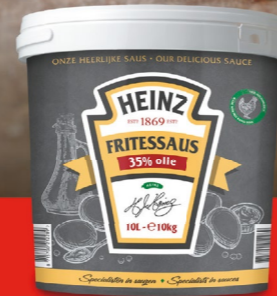
FRITESSAUS 35% 10 liter - 091852