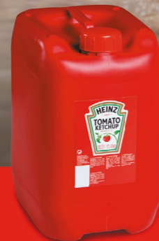
TOMATO KETCHUP 10,2 liter - 026926