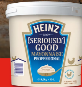
[SERIOUSLY] GOOD MAYO 10 liter - 091854